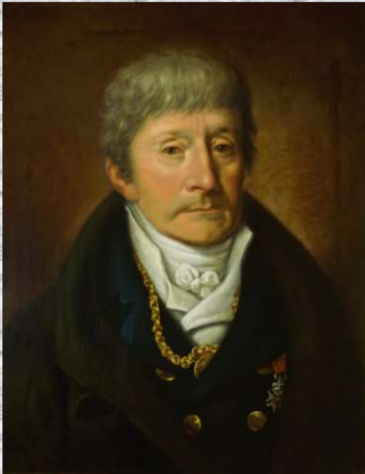
Антонио Сальери (1750 – 1825)

Итальянский композитор, педагог и дирижер Сальери был одним из наиболее знаменитых деятелей европейской музыкальной культуры рубежа XVIII-XIX века. Как художник он разделил судьбу тех прославленных в свое время мастеров, чье творчество с наступлением новой эпохи отодвинулось в тень истории. В жанре оперы он сумел достичь такого качественного уровня, который ставит его лучшие произведения выше большей части современных ему опер. С именем Сальери связана большая глава в истории оперного театра Австрии, немало сделал он для музыкально-театрального искусства Италии, внес вклад и в музыкальную жизнь Парижа.