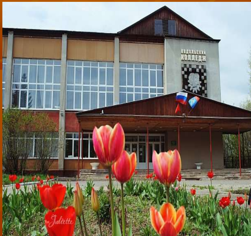
Подольский строительный колледж