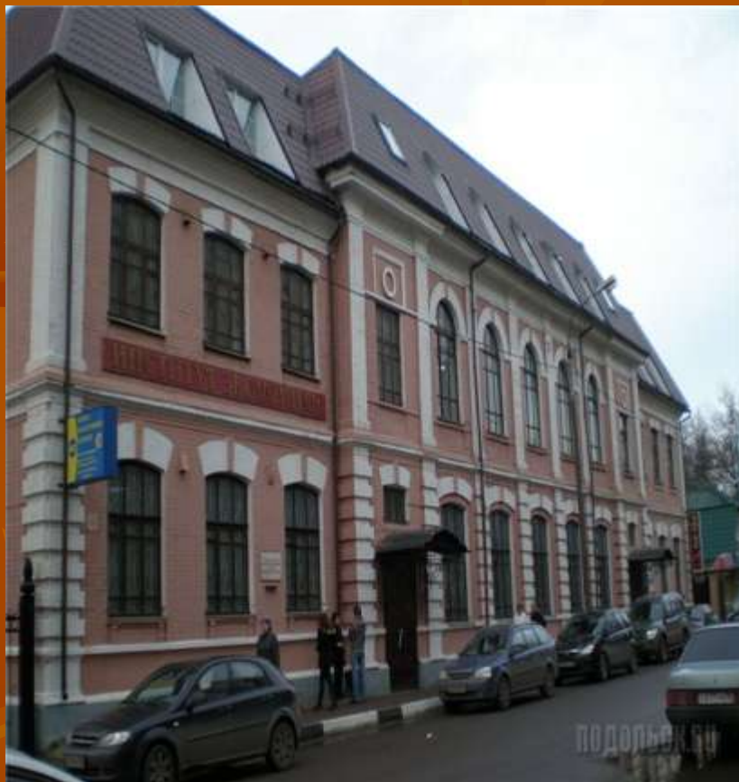
Российская экономическая Академия им. Г.В.Плеханова Институт экономики.