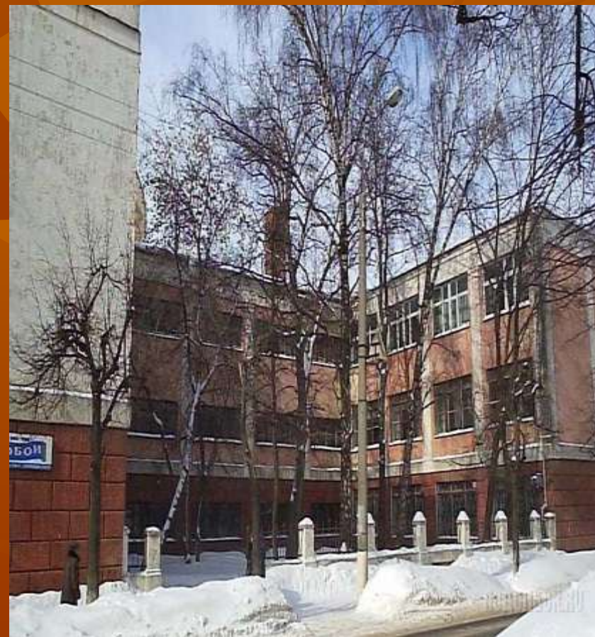
Подольский колледж сервиса